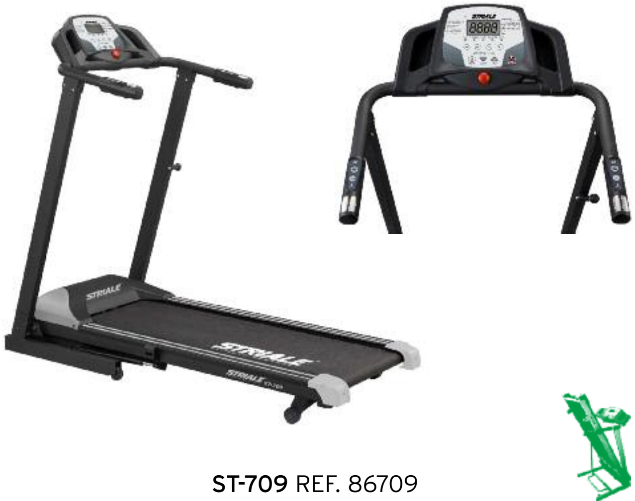
ST-709 REF. 86709