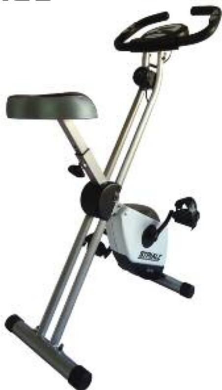
SV-311 REF. 86311