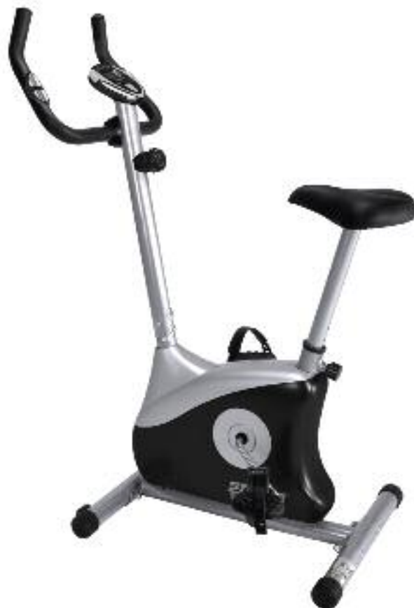
SV-320-3 REF. 86320-3